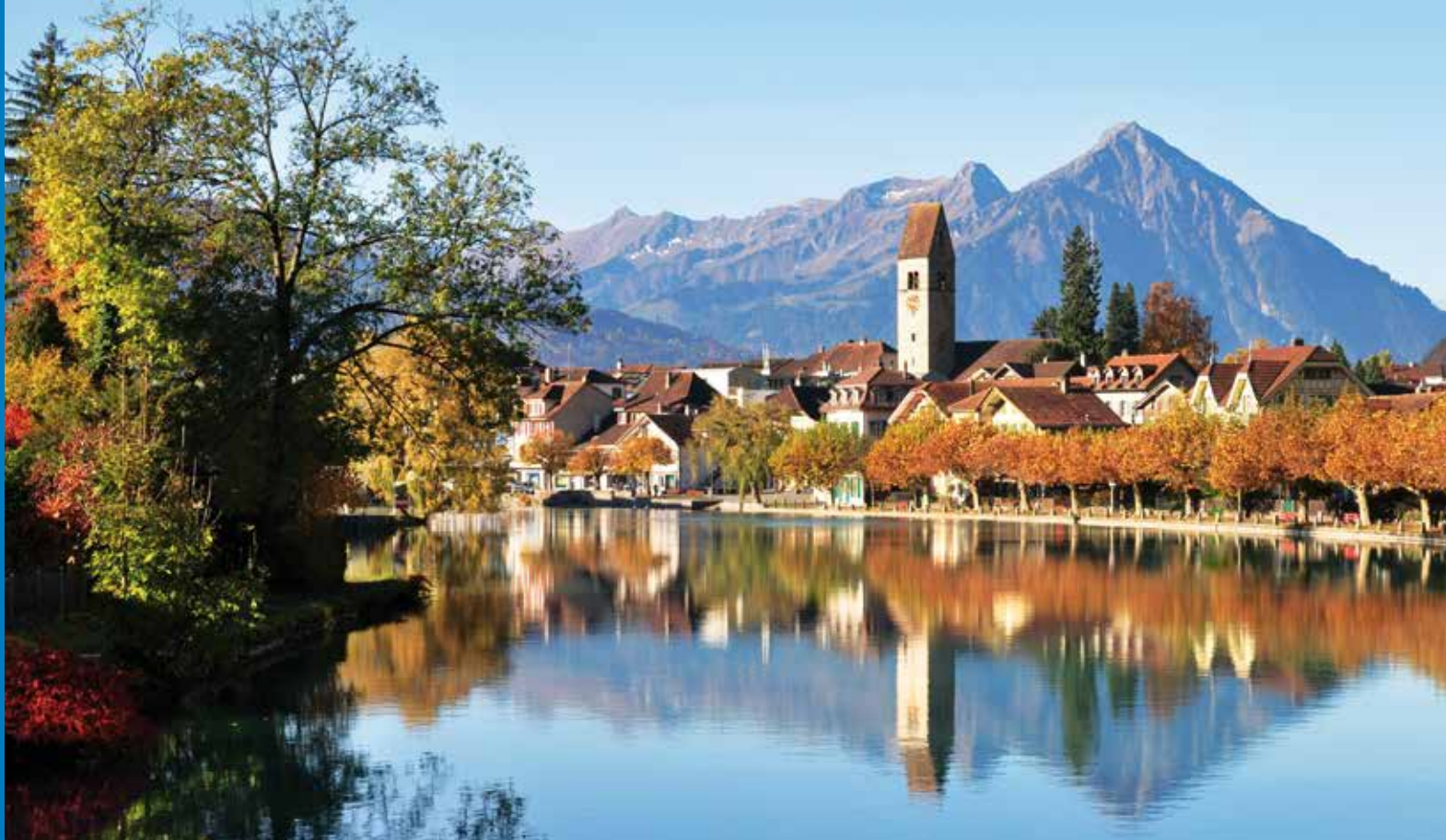
Engadin St. Moritz